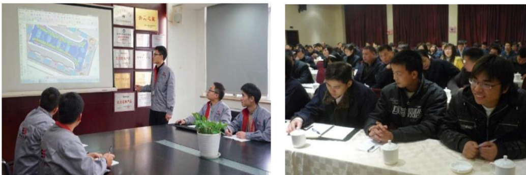
图 3.2-1 各类培训活动

公司将员工学习和发展视为“投资”，把创建学习型组织，营造全员学习的氛围作为公司长期发展战略的重要组成部分。随着公司规模扩大和全球化发展战略的实施，根据企业相关规定及各部门要求确定培训人员的需求情况。各部门负责人确定人员培训需求后经公司领导审批，相关部门每季度根据人员数量酌情进行培训计划的制定与实施。公司并成立了“劳仕学习室”，见图 3.2-1 所示。