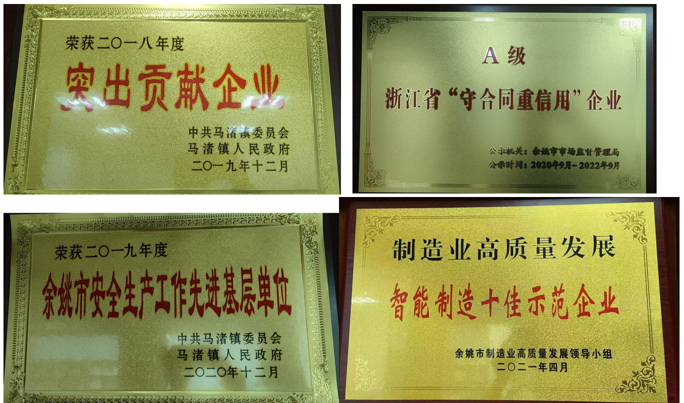
图 3.3-1 社会认可的证书（示例）

不安全状态及企业管理的缺陷等进行全员、全过程的安全管理，并积极开展“6S”管理、安全操作培训等一系列活动，此外积极进行生产区域内通风改造、安装废气处理设备等，不断改善员工的生活和工作环境。为此，公司先后获得政府、客户颁发的“突出贡献企业”、“浙江省守合同重信用企业”、“智能制造十佳示范企业”、“余姚市安全生产先进基层单位”等荣誉，如图 3.3-1 所示：