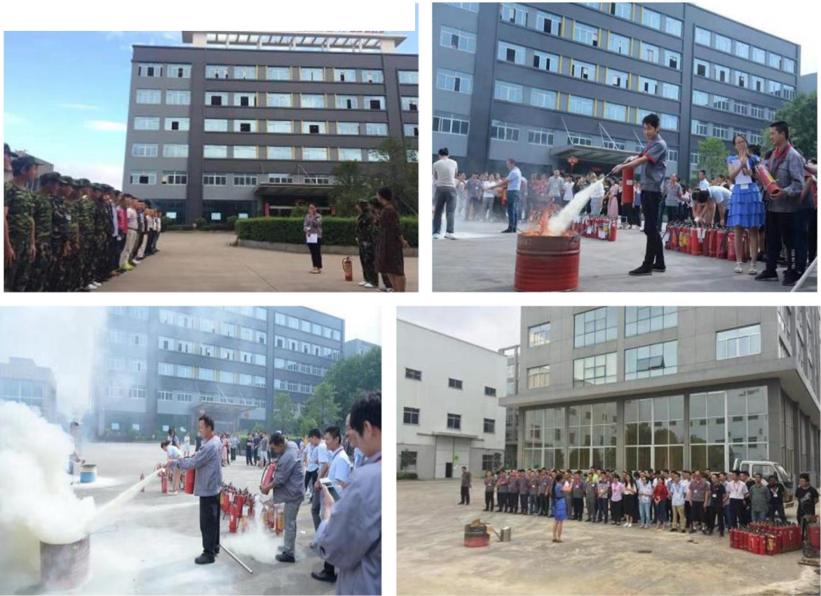
图 6.3-01 2022 年火灾应急演练记录

公司每年举行消防演练和各种灾害应急演练。公司制订了相关突发事件《应急预案》、《重大基础设施故障应急预案》等应急处置方案等，对火灾、机械伤害、触电、基础设施等均有相应的应急措施，并成立了应急指挥中心和应急救援专业组。